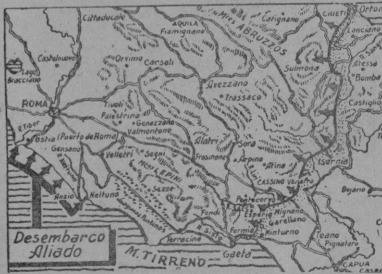
El lugar del desembarco y la línea de batalla que va de Ortona a Gaeta