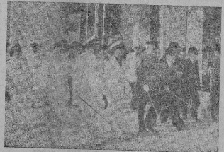
Las autoridades recorrieron después de la inauguración do el recinto de la Feria.

Alentar en la tarea silenciosa y callada de estos "productores-artesanos" que ahiguran su tecnicismo con una comprensión espiritual un tanto a la línea tradicional y al resurgir imperial de nuestra Patria refundiendo estilos, clasicismo e innovación en un sencillez y donaire que pregona el índice expresivo del interés con que en nuestra Provincia se suman a la pujanza y protección que nuestro Estado Nacional Sindicalista presta a la labor artesana.