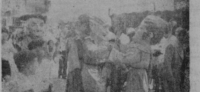
Los cabezudos danzando por las calles de Palma, en la comitiva anunciadora del comienzo de las fiestas