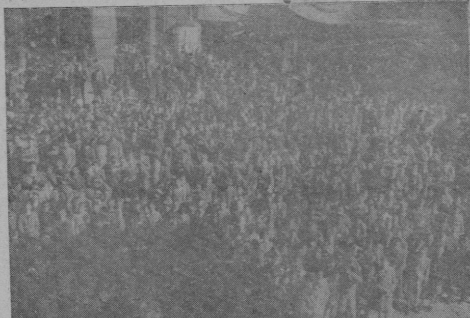
El canto de las Juventudes en la Plaza de Cort

En la plaza de Cort, todos los niños y niñas que asisten a las escuelas oficiales y particulares del caso de la capital, así como también centenares de niñas de las escuelas de niñas.