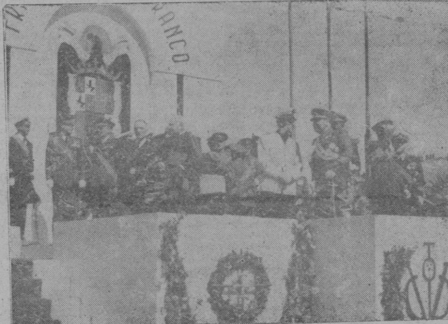
La tribuna principal con el Excmo. Sr. Capitán General acompañado por las demás Autoridades