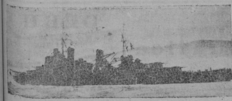
El crucero inglés "Manchester", de 9.300 toneladas, hundido en el Mediterráneo

La historia nos dice, a cada paso, que los pueblos que se duermen sobre los laureles y se entregan a la frivolidad y a la burguesía están condenados a la muerte.