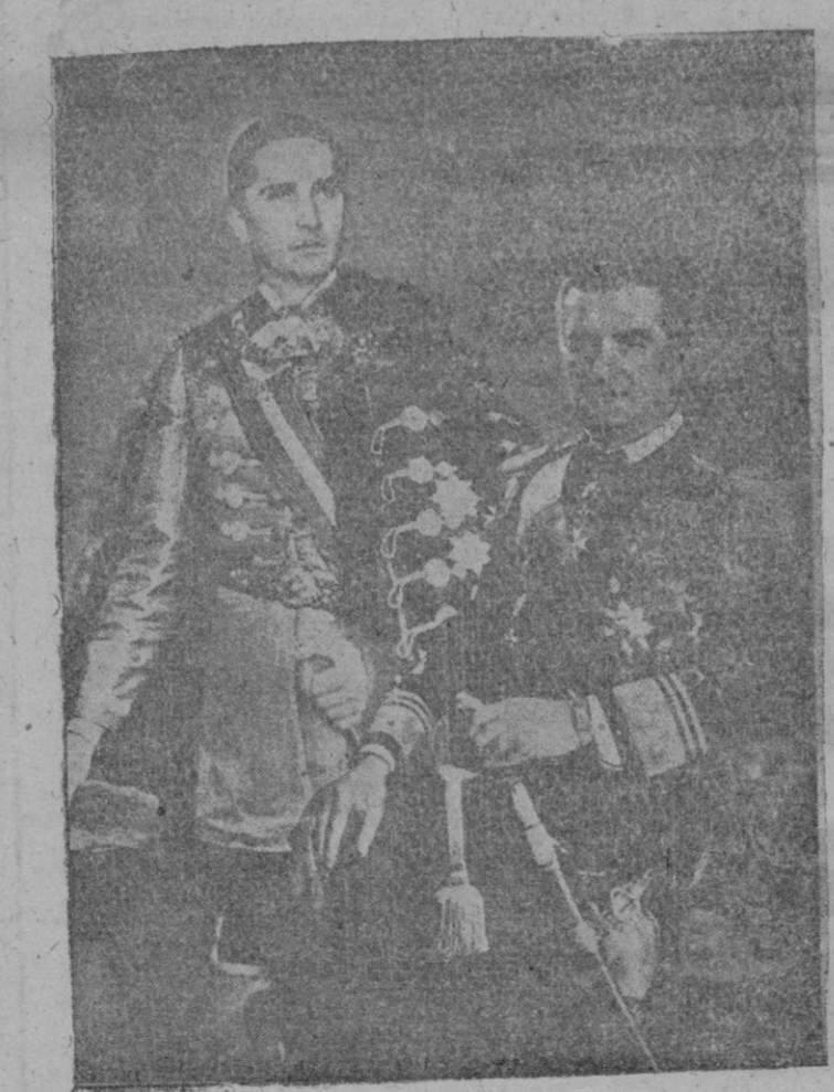
Estaban Horthy de Nagibanya, sucesor del regente de Hungría, que acaba de caer gloriosamente en los campos de guerra de Rusia. En la fotografía aparece con su padre, el regente conde Horthy.

Budapest. — El Consejo de Ministros húngaro se reunió en sesión extraordinaria después de conocerse la muerte del Vicerregente Horthy.