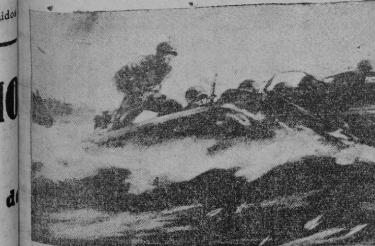
Canoas automóviles empleadas por los alemanes para proteger los trabajos de la ingeniería en el cruce de los ríos

Los evadidos son 23 oficiales y 107 marineros. El número de tripulantes internados era de 1.044. El informe que se está redactando será entregado a la Embajada de Inglaterra en Buenos Aires.