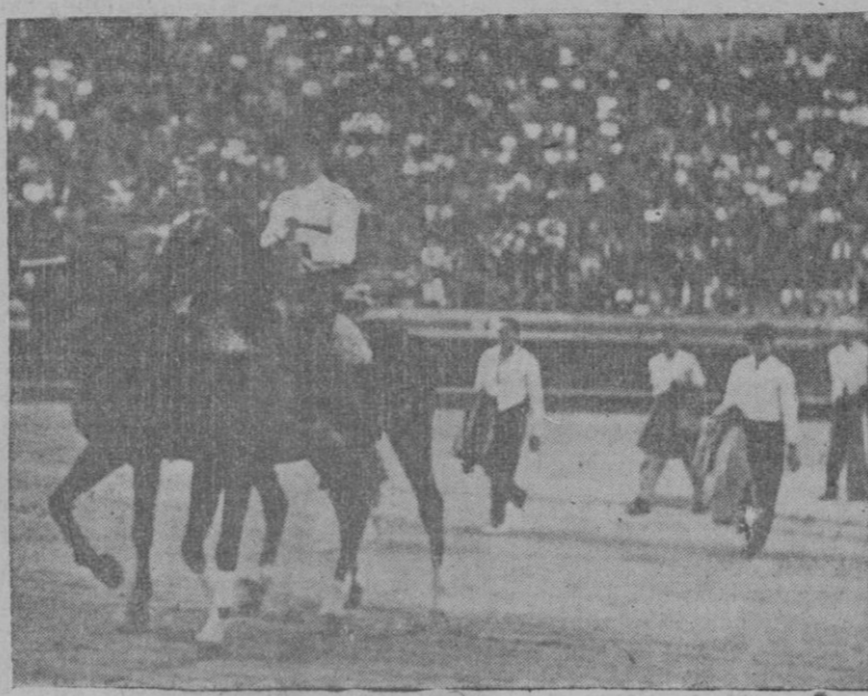
Del festival taurino de los Ingenieros. - Desfile de las cuadrillas