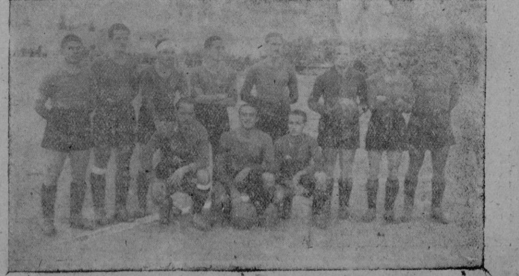
El equipo del Mallorca que ha ganado el Campeonato de Baleares

Por la tarde se celebrarán tres partidos a base de los jugadores siguientes: