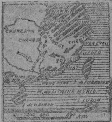
La ofensiva japonesa en China, respuesta a los ataques de Chang Kai Chek a la zona de Cantón, se desarrolla en tres direcciones, que han sido señaladas en el croquis

Hoy salen las camaradas de "Auxilio Social". Español prepara tu 0'30 para aliviar a los necesitados. Hoy cuantación de "Auxilio Social".