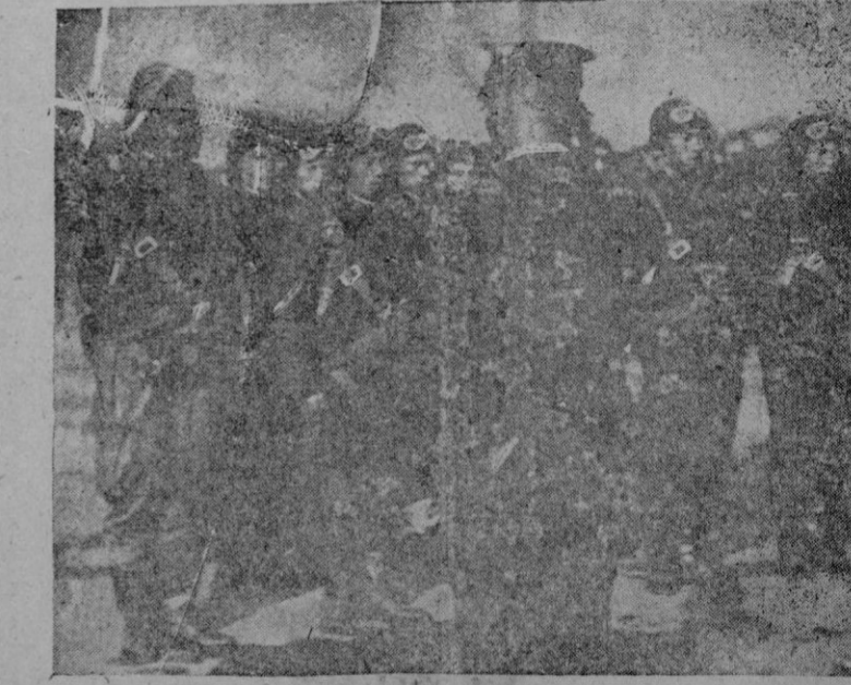
Paracaidistas japoneses que han aterrizado en Filipinas y marchan hacia Manila

Llegó de Porto Cristo el pailebot "Virgen Dolorosa". De Valencia el vapor correo "Mallorca". Han sido despachados para Barcelona el pailebot "Cala Contesa". Para Porto Cristo el pailebot "Virgen Dolorosa". Para Ciudadela el pailebot "Flor del Mar". Para Ibiza la balandra "Armando Palerm".