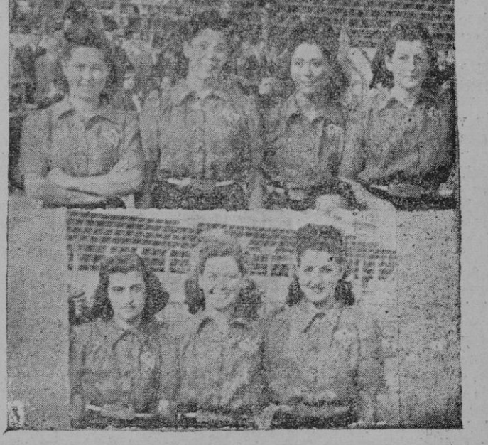
El equipo femenino de baloncesto del C. D. Mallorca, que el domingo hizo su presentación