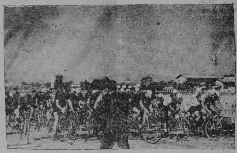
Momento de la salida de los corredores, al iniciarse la VII Vuelta Ciclista a Mallorca, en la pista del Hipódromo

JUSTICIA. — Ley adicionando un párrafo al artículo 440 del Código Penal. Decreto autorizando al Instituto Nacional de la Vivienda para conceder a la Mutualidad Benéfica de Funcionarios de Prisiones, a efectos de la construcción de viviendas, los beneficios legales propios del régimen de protección a las mismas. Decreto facultando al jefe oficial interventor de la División Azul para autorizar toda clase de actos o contratos que requieran intervención notarial. Decretos sobre movimiento de personal en las carreras judicial y fiscal y en el Cuerpo de Prisiones. Ordenes concediendo la libertad condicional a 3.190 reclusos. EDUCACION NACIONAL. — Decreto por el que se crea el Instituto de Antropología y Etnografía "Bernardino de Sahagún". Decretos por los que se declaran monumentos históricos y artísticos la fachada de la iglesia conventual de San Bernardo de Palencia y la capilla de San Juan Bautista de la iglesia parroquial de El Salvador de Valladolid. Decreto sobre dispensa de escolaridad a los alumnos de enseñanza media. Decreto por el que se organizan los tribunales de oposiciones a cátedras de Veterinaria. Numerosos expedientes de obras sobre monumentos nacionales, edificios de primera enseñanza y centros de enseñanza media y universitaria, entre los que pueden destacarse, de manera singular, la reparación de las cubiertas del monasterio de El Escorial y la terminación de las obras de la residencia nacional "Generalísimo Franco" del "Instituto Ramiro de Maeztu".