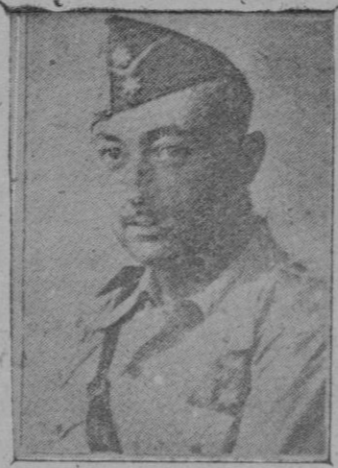
El señor marqués de Luca, de T. n.a., consejero nacional, director de "A B C", nombrado representante de España en Chile