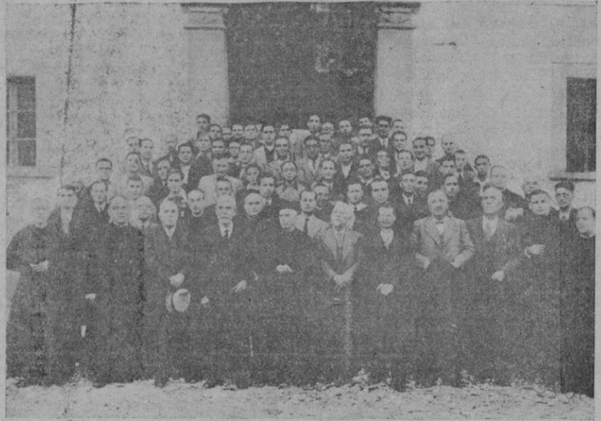
Antiguos Blavets de Lluç, en la asamblea celebrada para constituirse en asociación

En cuanto a funerales y otras ceremonias religiosas, se celebrarán de acuerdo con las autoridades eclesiásticas en horas que no interrumpen ni alteren el trabajo.