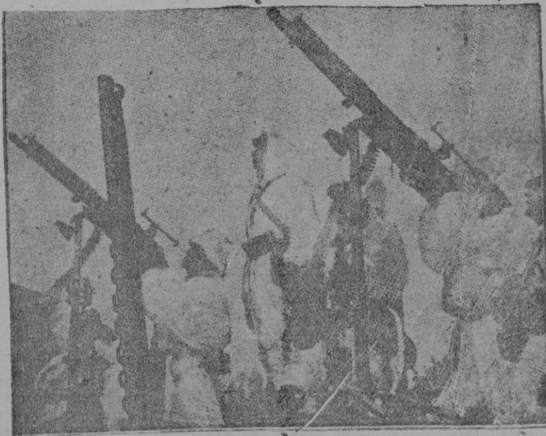
Artillería antiáerea de Finlandia; sus servidores van con uniformes blancos que les permiten confundirse con la nieve que casi todo el año cubre el país

Mas donde el "Stuka" se ha hecho inigualablemente temible ha sido sin duda, en los ataques a la escuadrilla inglesa. Si no, que lo dijera las cubiertas de las colosales unidades británicas, que, atónitas, vieron aterrizar en sus pistas, no a sus aviones propios, sino a las terribles bombas que los finos "Stukas" les lanzaban.