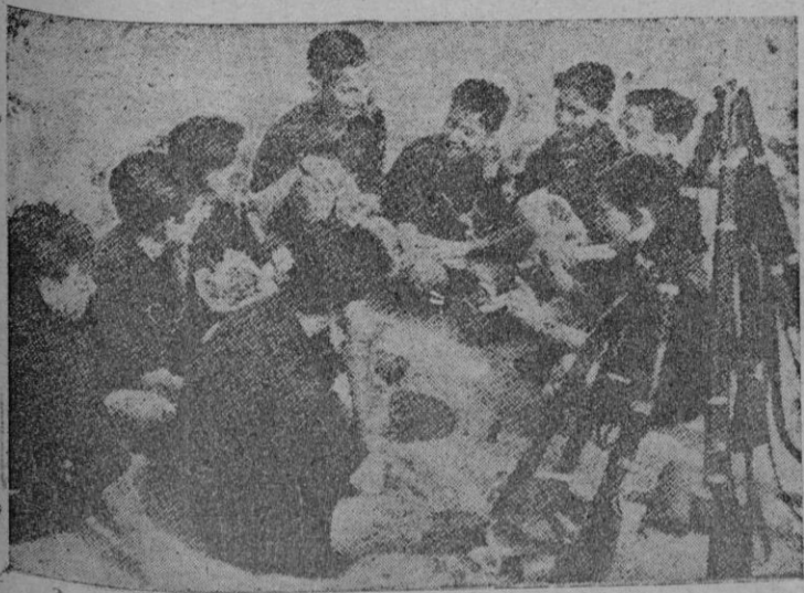
Los "flechas" en Madrid fraternizan después de sus ejercicios

Berlin. — Comentando el reciente acuerdo anglo-turco, la prensa ita-