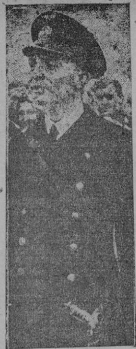
El capitán Prien, comandante del sumergible que torpedeó al "Royal Oak"

Novena. El Jurado, que tendrá mayoría de Arquitectos, estará presidido