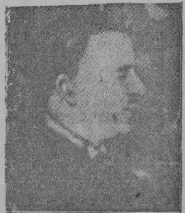
Doctor Burckhardt, comisario de la S. de N. en Dantzig, cuyas gestiones cerca de Hitler y de Halifax tanto han dado que hablar, en términos de confianza en un arreglo pacífico