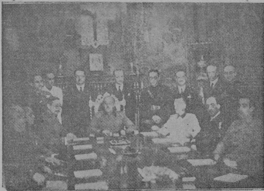
Primera reunión del Caudillo con el nuevo Gobierno