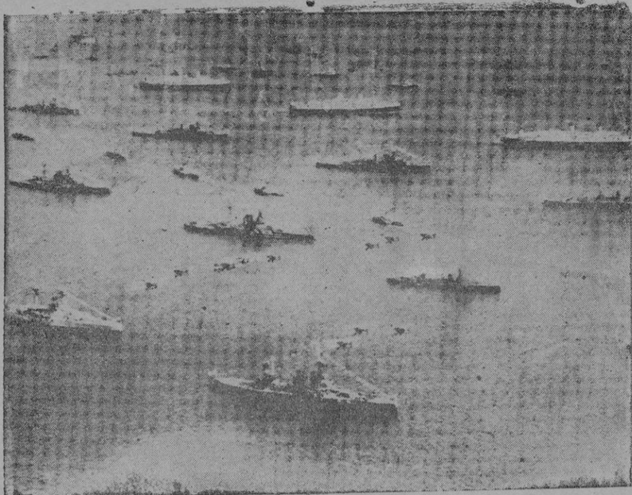
La flota inglesa de reserva en la bahía de Weymouth, donde fué revisada por el Rey de Inglaterra

La persona a examinar se introduce en una habitación de paredes aisladas, al abrigo de las ondas eléctricas que surcan el espacio en todas direcciones. Unos hilos conductores unen las compresas puestas sobre la frente del paciente con una antena de cuadro suspendida del techo de la habitación. La antena, a su vez, tiene contacto con los espinales de acero del oscilógrafo, instrumento maravilloso, que traduce las variaciones más sutiles del fluido eléctrico captado a través de las derivaciones de un intenso rayo luminoso que impresiona automáticamente estos movimientos sobre una placa fotográfica. Provisto de este extraordinario aparato, el profesor Cazzamalli ha examinado las radiaciones cerebrales de centenares de personas. Estudiantes, enfermos de su clínica sabios, escritores, artistas personas eminentísimas de Milán, se han prestado a las experiencias del sabio psiquiatra. Estas investigaciones continuadas por espacio de diez años, han dado impresionantes resultados. El profesor y sus asistentes han comprobado que las vibraciones eléctricas del cerebro aumentan cuando un pensamiento intenso atraviesa la psique. El sabio italiano ha demostrado que todos los matices de la amplia gama de las emociones humanas, alegría y tristeza, amor y odio, temor y ansiedad, cólera e indiferencia, modifican — cada uno con un trazo peculiar — el ritmo de las ondas normales que aparecen al revelar la película del aparato re-