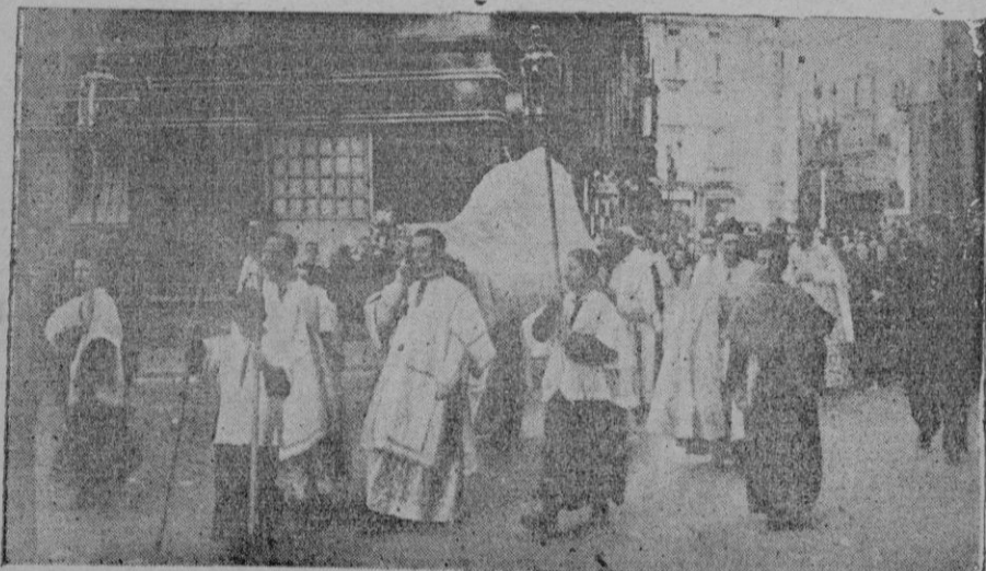
La procesión de la Asunción, que salió anteayer de la Catedral, recorriendo las calles de Palma.