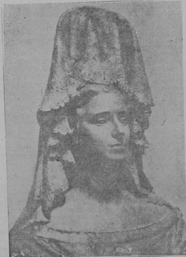
Busto en bronce de la ilustre esposa del Caudillo, obra del eminente escultor italiano De Marchis