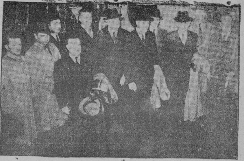
Las misiones francesa e inglesa que han salido de Londres para Moscú. En ella figuran, el general Vallin, el comandante Villaume, el comandante Harding, el almirante Plunkett, el general Doumens, el comandante Krebs y el mariscal Burnett.

Con la creación de la "Subcomisión de frutos secos Rama Almendra", se dió una más completa organización a la modalidad establecida en la campaña anterior para la liquidación del citado fruto. Y requerida la Banca local para anticipar la suma necesaria destinada al pronto pago a los agricultores del importe del almendra entregado por éstas, nuestra Entidad ofreció contribuir en la misma proporción que los demás colegas al