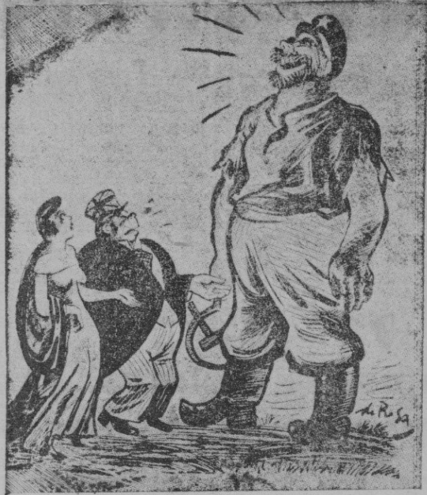
EL HUMOR AJENO. — Los predicadores de Europa: Una limosnita de ayuda a esas dos víctimas del fascismo

No abundaba ciertamente en este sentido de laxitud el hombre apostólico que dirigía la conciencia y los actos públicos y privados de la santa doña Isabel de Castilla. Acercábase mucho más al sentir rígido que algunos decenios más tarde dictó una bu-