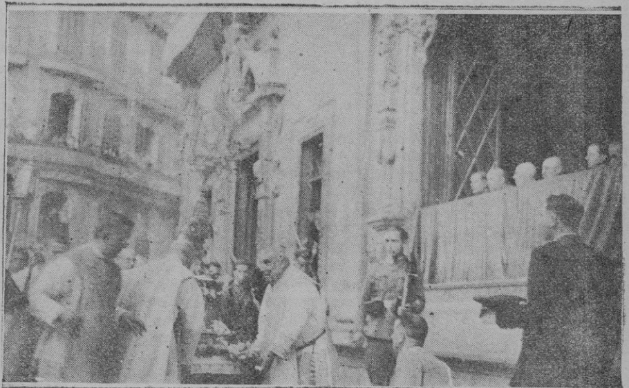
La procesión del Corpus en Palma. -- El paso de la Custodia por sobre la mesa cuajada de flores, con la bandera española, frente a las Autoridades en la Plaza de Cort

Acto seguido, el Prelado se dirigió al palacio episcopal, acompañado de gran número de fieles, que al llegar al zaguan, desfilaron ante S. E., besándole el anillo pastoral. LA PROCESION Libre de la pesadilla de un laicismo que se había impuesto a los más caros sentimientos de los españoles en el año 1931 y en el encendido ambiente de una paz victoriosamente lograda, supo nuestra ciudad manifestarse anteayer tarde