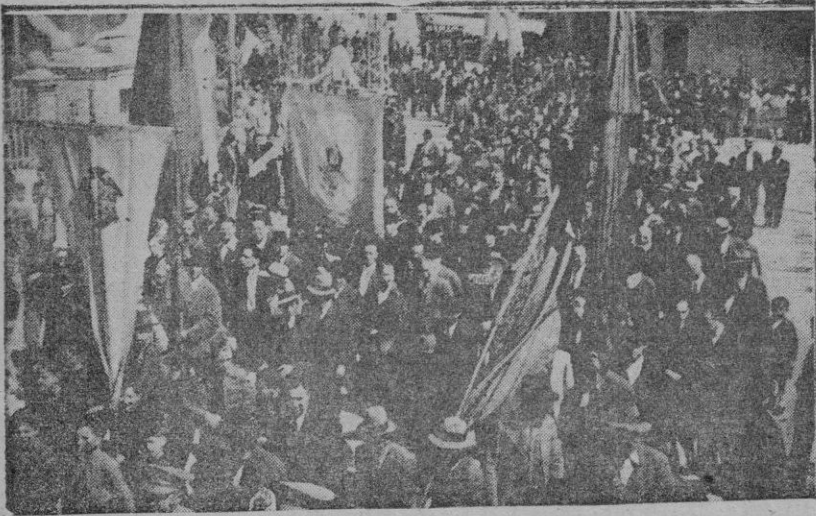
La peregrinación valldemosina al dirigirse al sepulcro de Santa Catalina Thomás

Todo el pueblo se asoció al piadoso acto elevándose a unos mil doscientos el número de peregrinos que realizaron a pie todo el recorrido y llegando a formar un núcleo de unos mil ochocientos, con los que se sumaron luego, entre los que figuraban numerosas familias palmesanas que poseen fincas en el referido término municipal de Valldemosa.