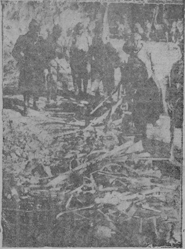
Soldados franceses recogiendo los fusiles que los milicianos rojos abandonaban al cruzar la frontera

cinco han sido ocupados por nuestras tropas victoriosas.