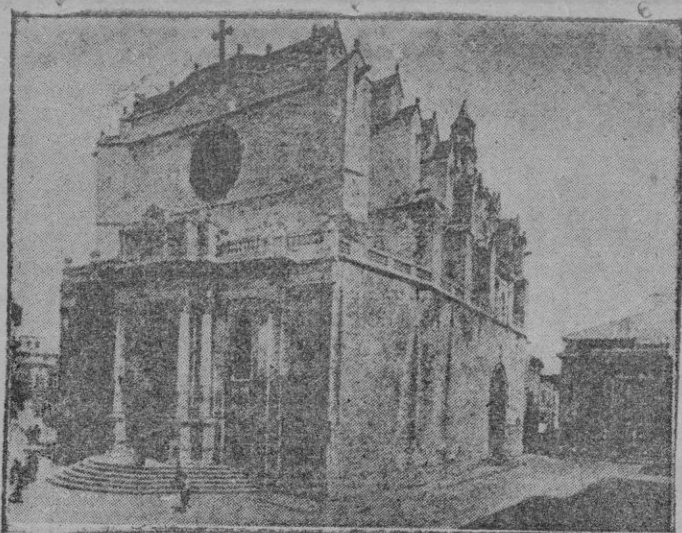
La Catedral de Ciudadela