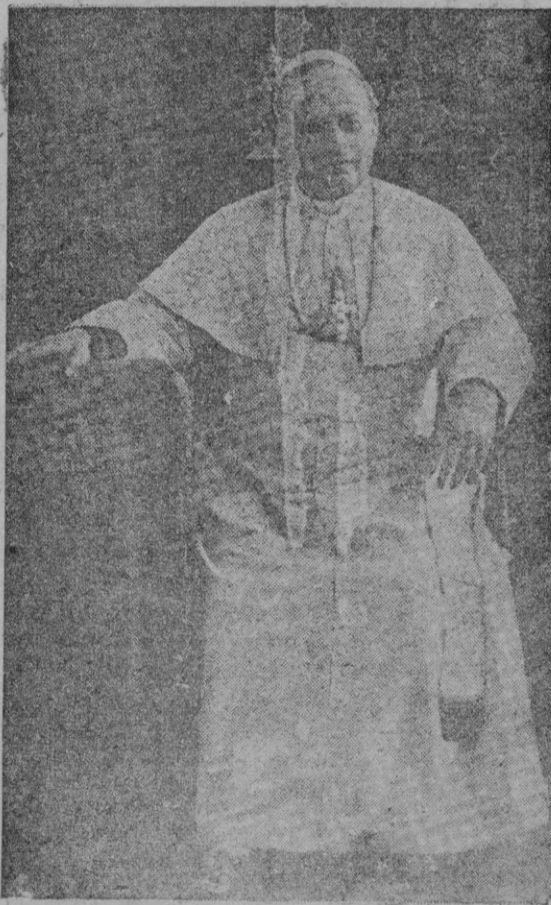
S. S. el Papa Pío XI

te minutos se le administró oxígeno para facilitarle la respiración pero la última fase de su vida terminó poco tiempo después de las cinco. Recobró últimamente el sentido y pronunció pocas palabras, las últimas fueron "Paz a Italia" Jesús".