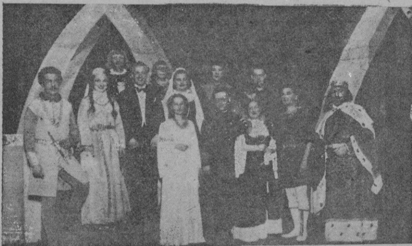
Los principales intérpretes y los autores de la obra