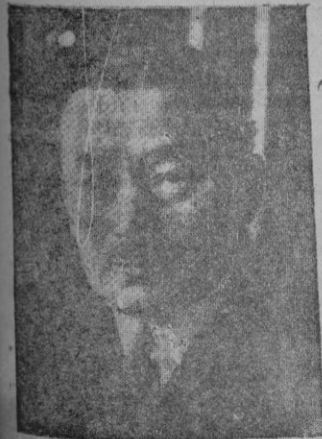
El ministro de Hacienda francés M. Reynaud, cuyos proyectos para salvar la economía francesa encuentran fuerte oposición en las masas marxistas de la vecina república