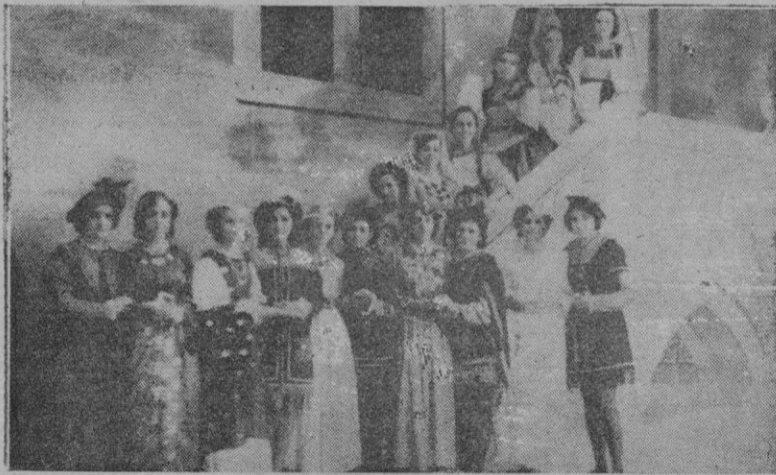
Las señoritas que formaban la corte

una faceta del alma de niño que era el intrépido aviador.