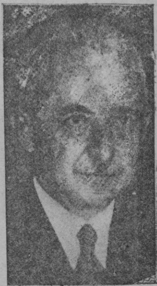
Ismet Inonu, que ha sido elegido Presidente de Turquía, sucesor de Kemal Ataturk

Esta semana de Luto Nacional se exaltará y concretará el próximo domingo. Publicamos en estas páginas el programa. Serenidad, austeridad cristiana. La ALMUDAINA se asocia de todo corazón al sentimiento nacional, como participa y participará el pueblo con su presencia en los actos, sus preces y su fervor patriótico.