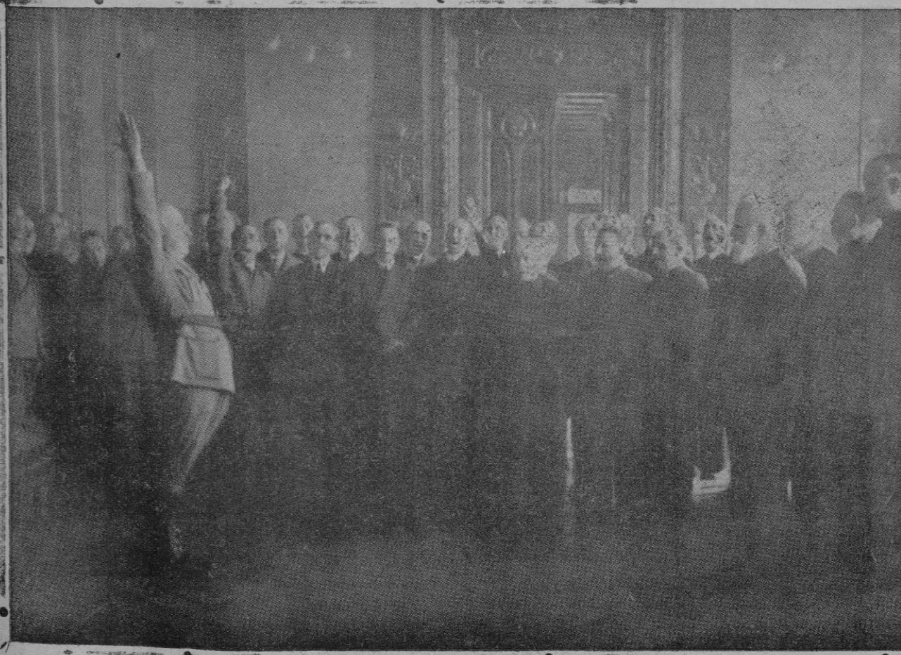
La proclamación en Burgos, el 1.º de Octubre de 1936, del Generalísimo Franco, Jefe del Estado Español

tud que desborda a todos los corazones españoles dice más que el índice de la ingente labor realizada por el Caudillo. Gratitud en todos, en altos y modestos, en ricos y pobres, porque la serenidad augusta de la Justicia preside y da rango supremo a las decisiones del Caudillo.