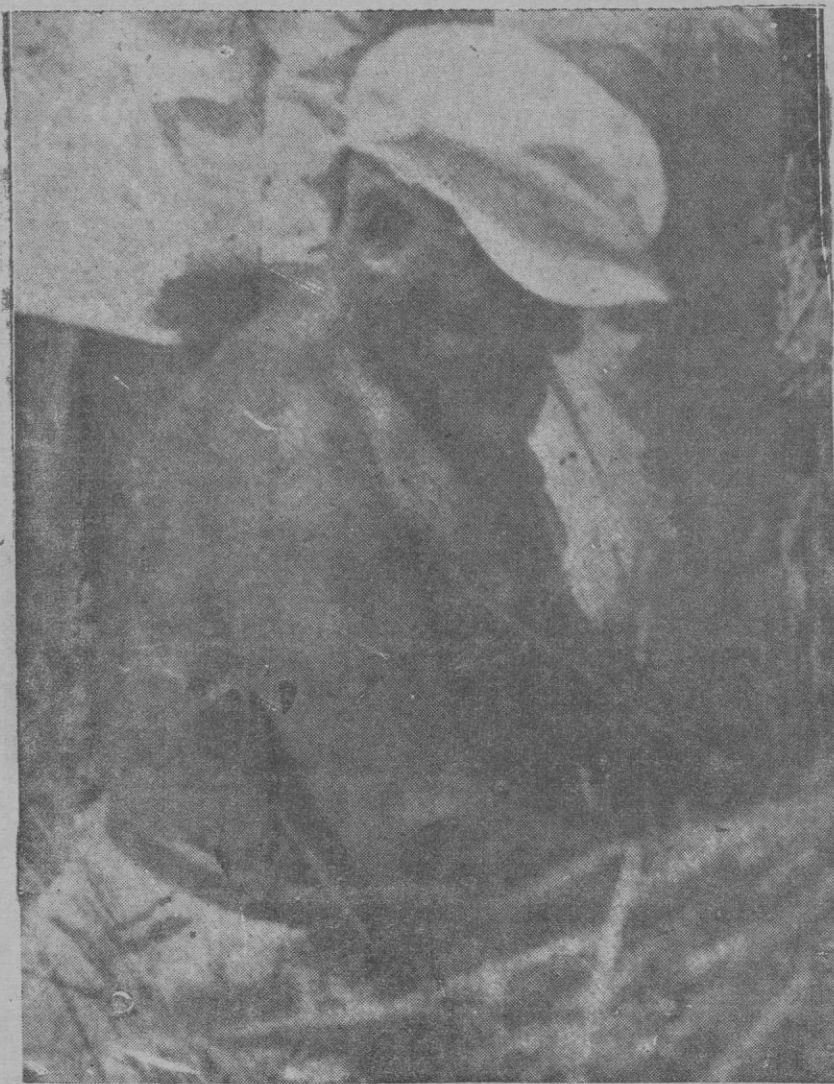
Mussolini, el torso desnudo, trabajando cuatro horas en la "trilla del grano"