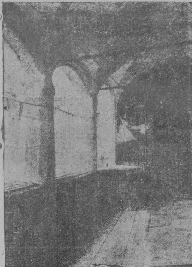
La casa natal del Führer, en Braunau sull In, para la cual ha sido la primera visita de Hitler en su viaje a Austria.