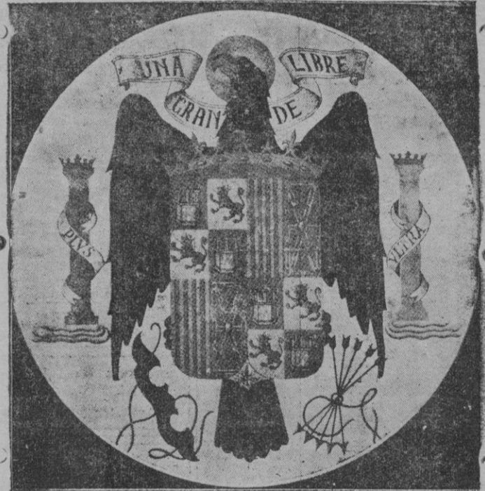
El nuevo Escudo de España

Y luego esta prodigiosa variedad se unifica mediante dos conceptos básicos que pueden sintetizarse en estas palabras. Fe y Patria, o en estas otras: la Cruz y España. En tan santos y nobles ideales convergen todas las poesías de Pemán, aún aquellas que, por su asunto, parecen apartarse del tema capital, pues que acontece con ellas lo que con los riachuelos cristalinos, afluyentes de los grandes ríos, que aunque serpean y cantan libres en un principio, acaban por juntar sus linfas con las del río grande forman de un único y copioso caudal.