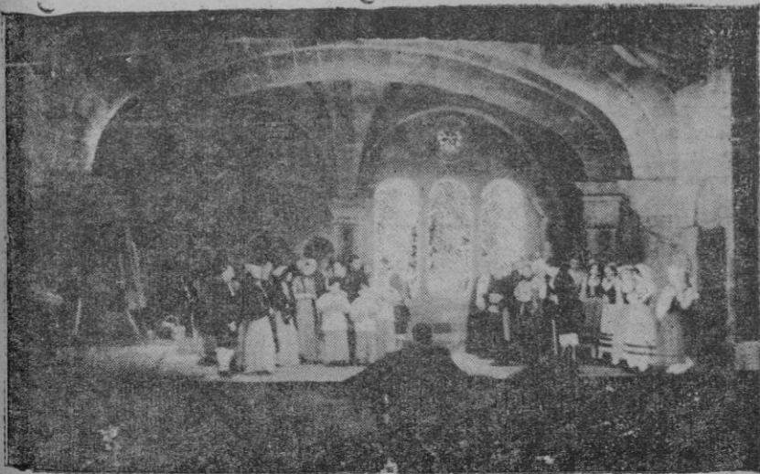
"La Tosca" en el Principal. Escena final del primer acto.