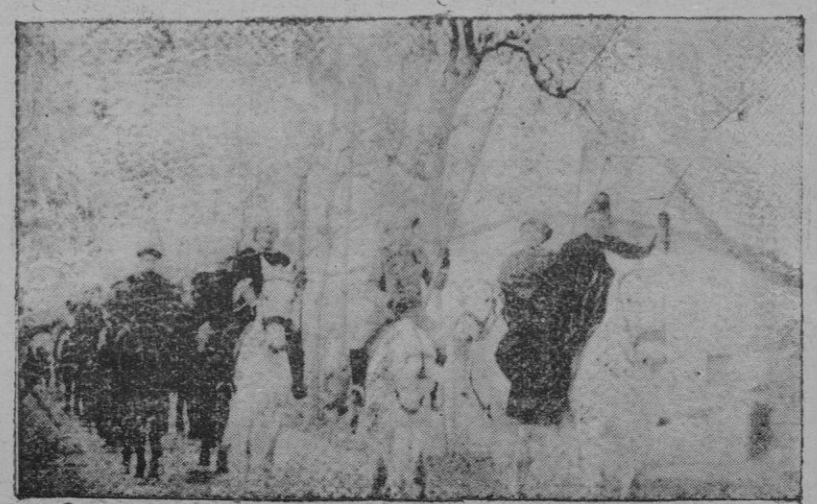
Los detalles de la Cabalgata de los Reyes Magos celebrada ayer tarde en Palma