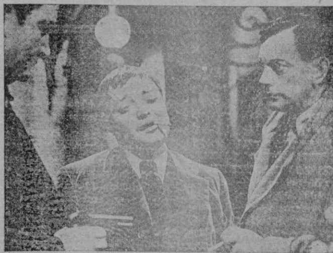
Una escena del emocionante film

El heroísmo de Teruel no puede manifestarse en una crónica de guerra; hoy ha rechazado su guarnición con bravura sobrehumana los ataques enemigos que al atardecer y en los sectores exteriores ha sido de una dureza formidable. Hay que entrar en Teruel; esa era la orden cursada, la orden imperativa que ayer transmitió el mando rojo a los que debían asaltar la ciudad. Acaso es un dato que dice más que todos los cometarios el que el general Vicente Rojo, jefe del estado mayor marxista ha tomado a su cargo el mando del 4.º cuerpo de ejército que opera en Teruel, ante la magnitud de los acontecimientos y la difícil situación de las fuerzas rojas en el frente de Teruel. Pues bien, ha llegado Rojo y Teruel sigue firme serena en su grandiosa epopeya bajo el fuego enemigo sobre las casas doloridas de la ciudad, a despecho de su impetencia y de su derrota gigantesca. Teruel sigue en pie. En la