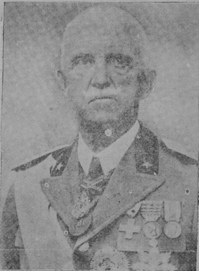
LA RECEPCION DE AYER

Palma, en la genuina representación de las autoridades, elemento oficial y ciudadanos, quiso unirse a la fiesta que Italia tributaba a S. M. Real e Imperial Victor Manuel, Rey de Italia y Emperador de Etiopía, al cumplir los 63 años de edad.