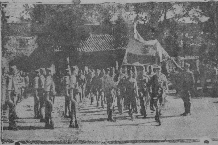
Dos momentos de la jura de la bandera