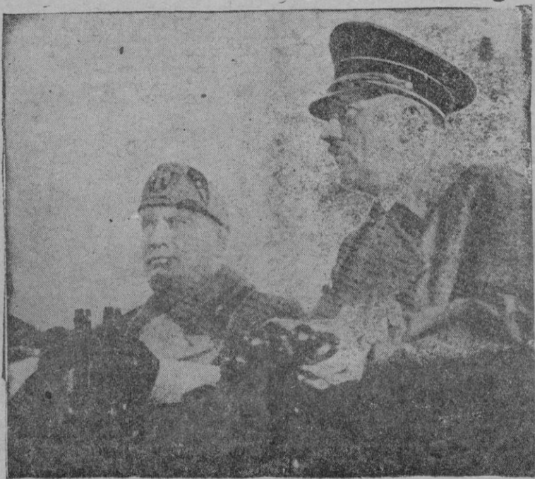
Mussolini y Hitler presenciando las grandes maniobras del Ejército alemán