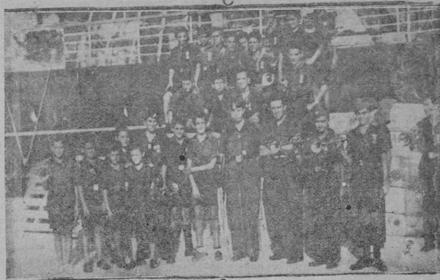
Llegada de los flechas mallorquines procedentes de Italia

últimos estudios en este Centro podrán trasladar sus expedientes académicos respectivos al Instituto que deseen, sin pago de derechos de ninguna clase, para lo cual se mantendrá funcionando la Secretaría de aquél.