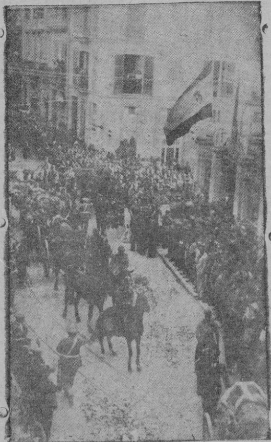
Entierro de los aviadores legionarios, ante una inmensa muchedumbre

HOY, a las cinco tarde INAUGURACION DE LA TEMPORADA