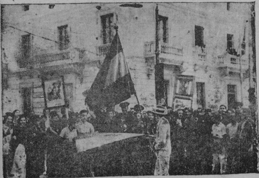
De la toma de Bilbao. — La manifestación del sábado, recorriendo las calles de Palma