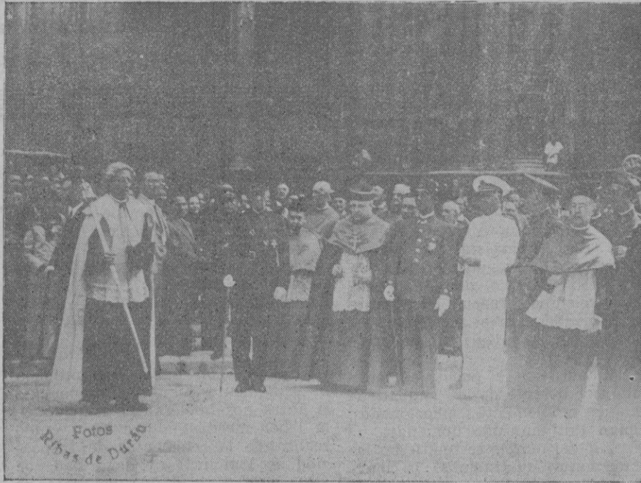
Las autoridades al salir del Te-Deum celebrado anteayer en la Catedral