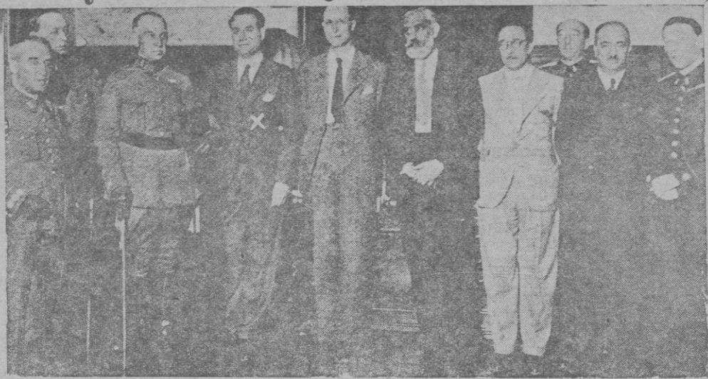
Se ha hecho cargo de los servicios de Orden público de la Generalidad de Cataluña el capitán señor Escofet, recientemente nombrado comisario general de aquellos servicios. El capitán Escofet en el acto de la toma de posesión