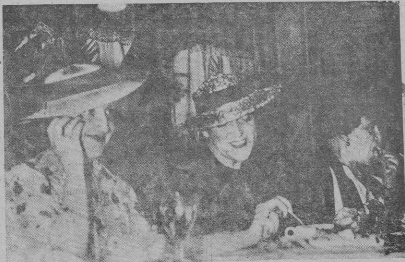
Un grupo de damas republicanas ha ofrecido un té de honor a la señora de Casares Quiroga. En la foto, la señora de Casares Quiroga entre la esposa de Su Excelencia el Presidente de la República (a la izquierda) y la señora de Martínez Barrio