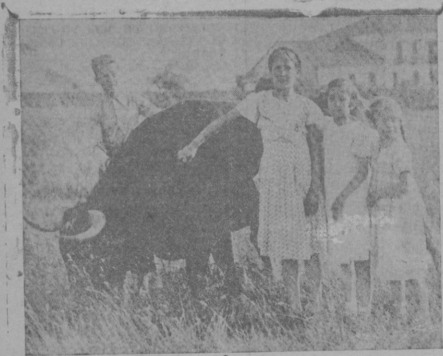
El toro "Civilón" con las hijas del dueño de la ganadería, que a pesar de su bravura, le acarician como si fuera la bestia más inofensiva

Salvo contra orden son esperados hoy los paquebotes ingleses "Staffordshire", "Voltaire" y "eKmendine" y el norteamericano "Exochorda".