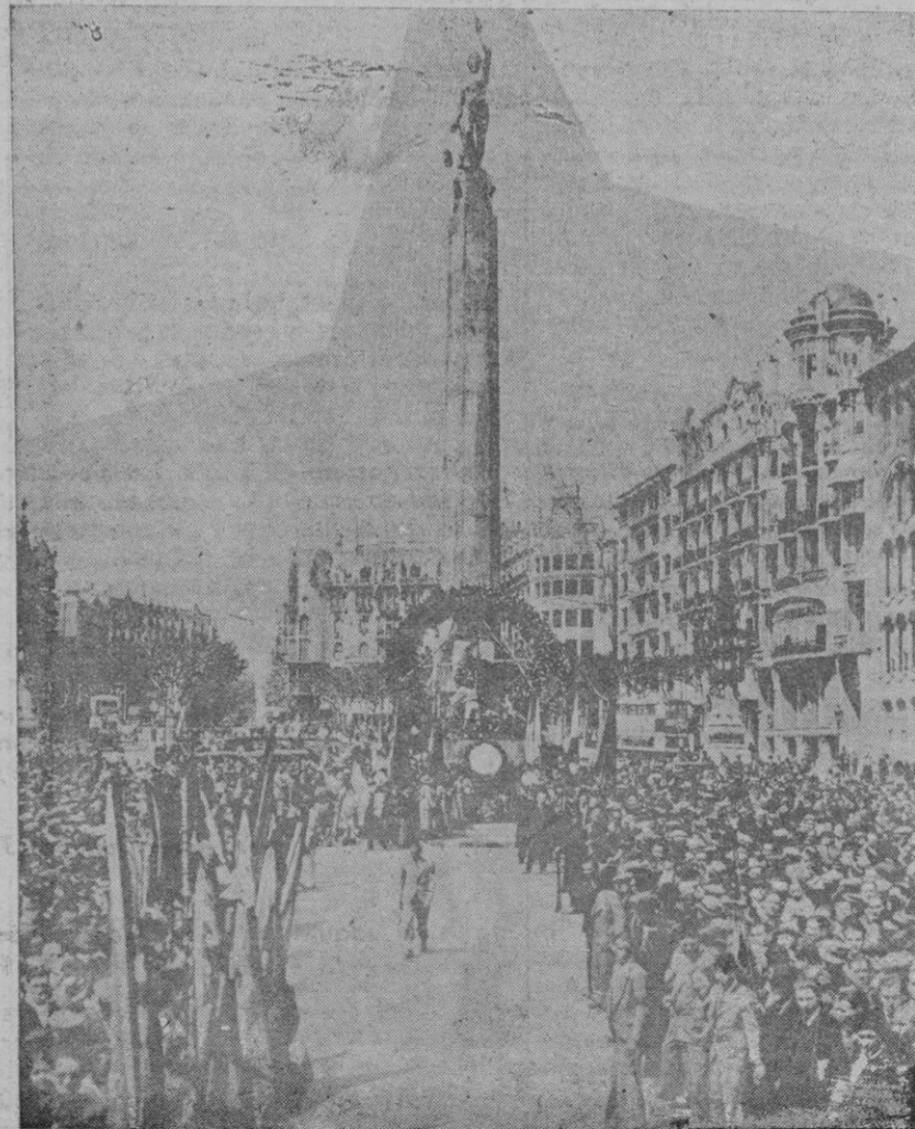
Acto de la inauguración del monumento a Pi y Margall, celebrado en Barcelona