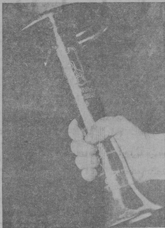
En los juegos olímpicos que se efectúan en Berlín, se encenderá una antorcha en Olympia, Grecia, y esa antorcha será trasladada a Berlín por atletas que a través de seis países distintos se llevarán para transportarla. — El porta antorchas que se usará para la marcha

acogida con grandes aplausos y vivas a la llegada del Alcalde Sr. Darder y concejales.