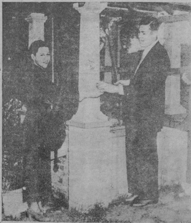
Louis, el hombre de hierro que acaba de abatir a Uzcudun, vedle aquí, como un colegial en idilio con su joven esposa

"Con el margen de tiempo suficiente para que los brotes de la pasión más legítima no puedan enturbiar la serenidad del pensamiento ni del ánimo, creo un deber inexcusable dirigirme a la opinión en estos momen-