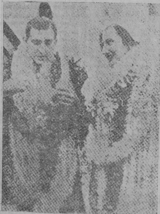
D. Juan de Borbón, durante su viaje de bodas con D.ª María de las Mercedes ha visitado Honolulu. La joven pareja adornada con flores típicas de aquel país