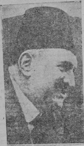
El rey de Egipto cuya personalidad ha cobrado relieve excepcional con motivo de la agitación antibritánica reinante en su país