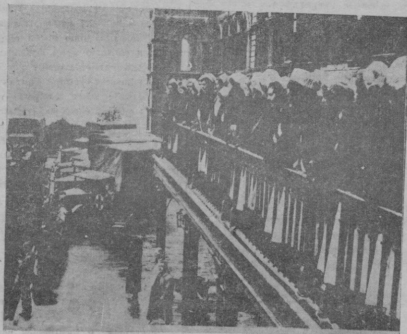
Londres. — El personal de la Cruz Roja inglesa que salió para Etiopía, reunido en el hospital de Santo Tomás