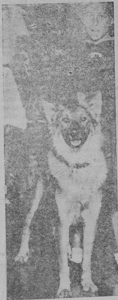
Patrocinado por la Sociedad Protectora de Animales, ha tenido lugar en Sitges un homenaje al perro "Terry", que salvó a un hombre y a una niña que estaban a punto de ahogarse en el mar