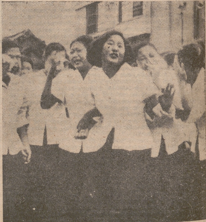
SEUL. — Muchachas de una escuela de esta capital lloran, emocionadas, durante la demostración en contra de la tregua, que puede dejar dividido al país, celebrada frente a los alojamientos de los corresponsales en esta ciudad

La posición de España, entretanto, continúa haciéndose cada vez más fuerte, conforme se tambalean las otras naciones, y si aquí no quieren reconocerlo a voz en grito, es sobre todo, por miedo a que se enteren los españoles y les exijamos demasiado.