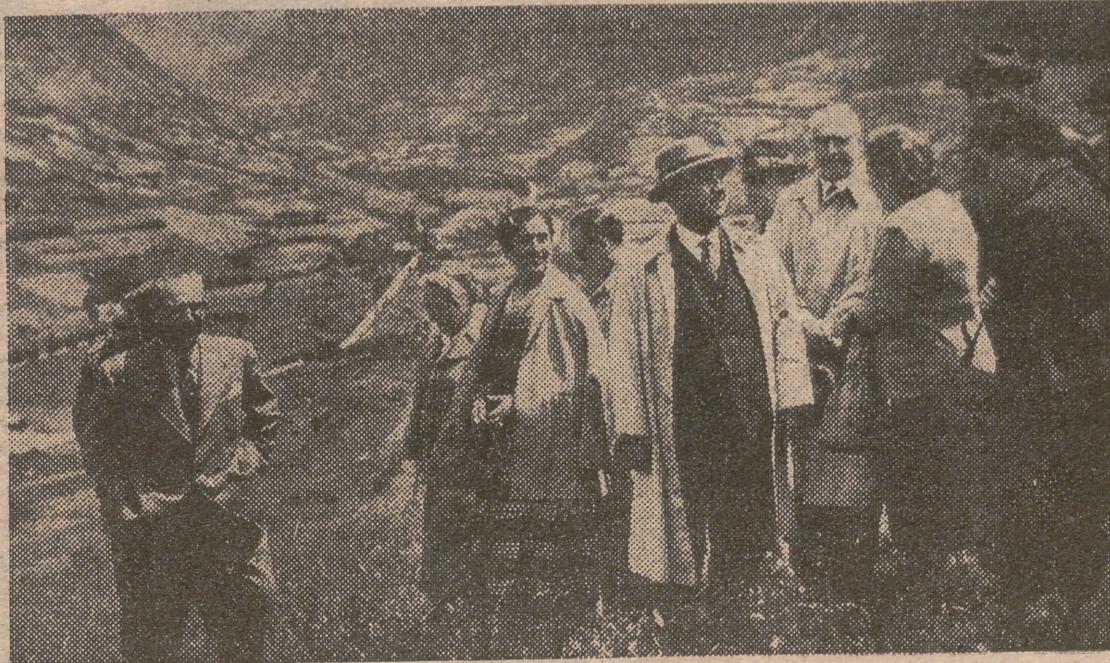
VIELLA. — S. E. el Jefe del Estado y las personalidades que le acompañan, durante su visita al Valle de Arán, donde se encuentra el túnel de Viella.