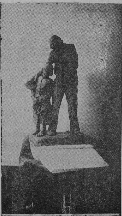
Grupo escultórico "Gratitud", para el panteón de la familia Alemany, obra del escultor señor Vila