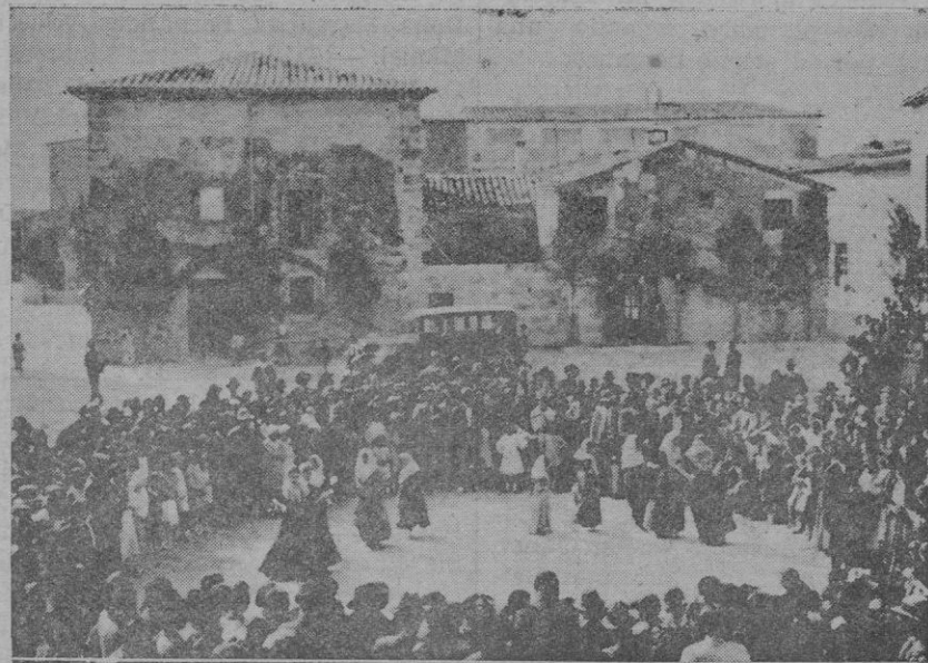
Baillando la Balanguera en la plaza Mayor de Costitx, en honor del centenario "Catiu"

El Juzgado de San Antonio Abad, practica las diligencias del caso.