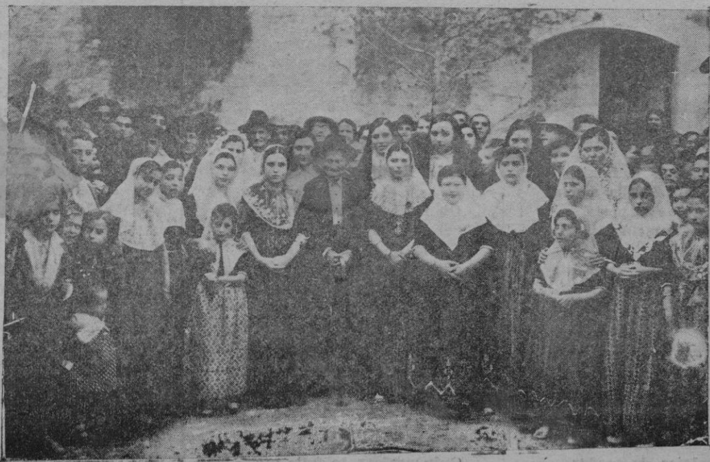
Costitx. — El centenario "Catiu" después del lunch al que asistieron 250 familiares y payesas de Costitx dirigiéndose a bailar La Balanguera frente la Casa Consistorial