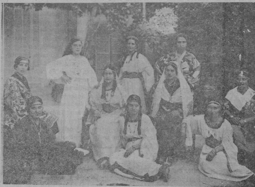
'La esclava de Fabiola', función dada en el convento de las Hermanas de la Caridad de San Juan