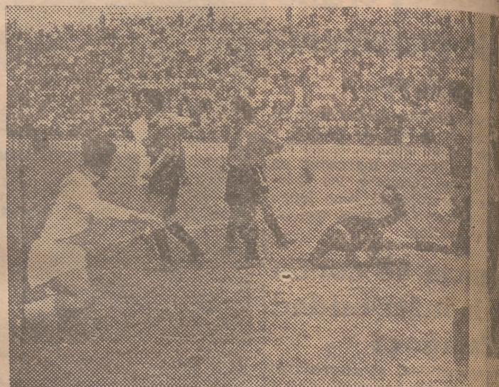
He aquí una de las muchas escenas que se originaron a lo largo del encuentro entre valencianos y murcianos, partido pródigo en incidentes, debido, primero, a las violencias de los forasteros, y en segundo lugar, a la debilidad del árbitro que las toleró. Un blanco detiene a un murciano que se dirige amenazadoramente a otro merengue, del cual sólo vemos la mano extendida, mientras el árbitro, seguramente, piensa que mientras la cosa no vaya con él, todo va bien.