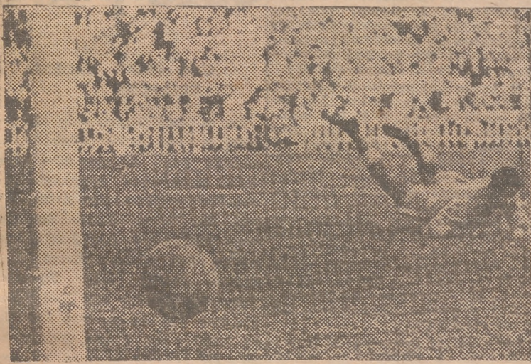
Tener cuatro ocasiones de marcar en todo un partido y aprovechar dos, es tener buena estrella. Y eso hizo el Zaragoza. Para postre, algún remate certero de los merengues no entró en la jaula por muy poco, como éste...

ector de Higinio, que estuvo estupendo, funcionó perfectamente. Y con su severo marcaje, hombre por hombre, y la fortuna y la oportunidad de aprovechar dos de las tres o cuatro ocasiones que se le presentaron, el Zaragoza, cuyos jugadores rayaron a una misma altura de entusiasmo y acierto, se llevó un punto, que ni ellos mismos habían soñado en "cazar".