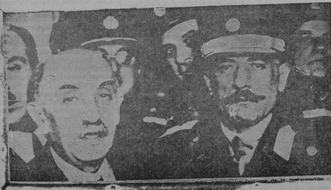
El señor Tsaldaris, presidente del Consejo, y el general Condylis, principales factores de la restauración