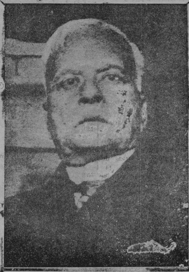
El presidente de la República griega, señor Zaimis, cuya dimisión es esperada con motivo de los trabajos para la restauración de la monarquía