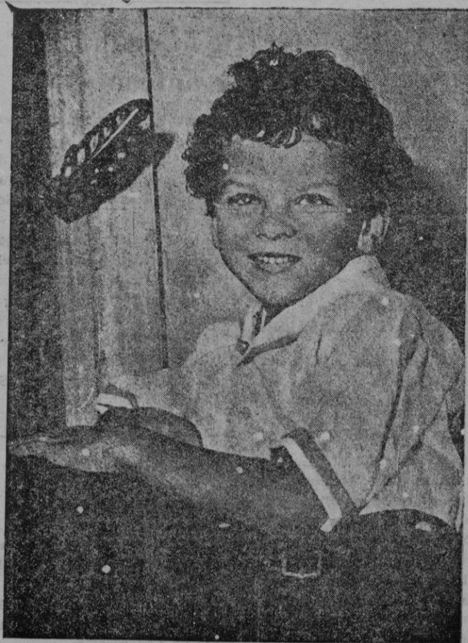
El niño a quien los defensores de Hauptmann sostienen que es el hijo de Lindbergh, para demostrar la inocencia de Hauptmann que está condenado a la silla eléctrica

Por dicha fuerza se instruyó el correspondiente atestado que fué entregado con el chofer de referencia al Juzgado.