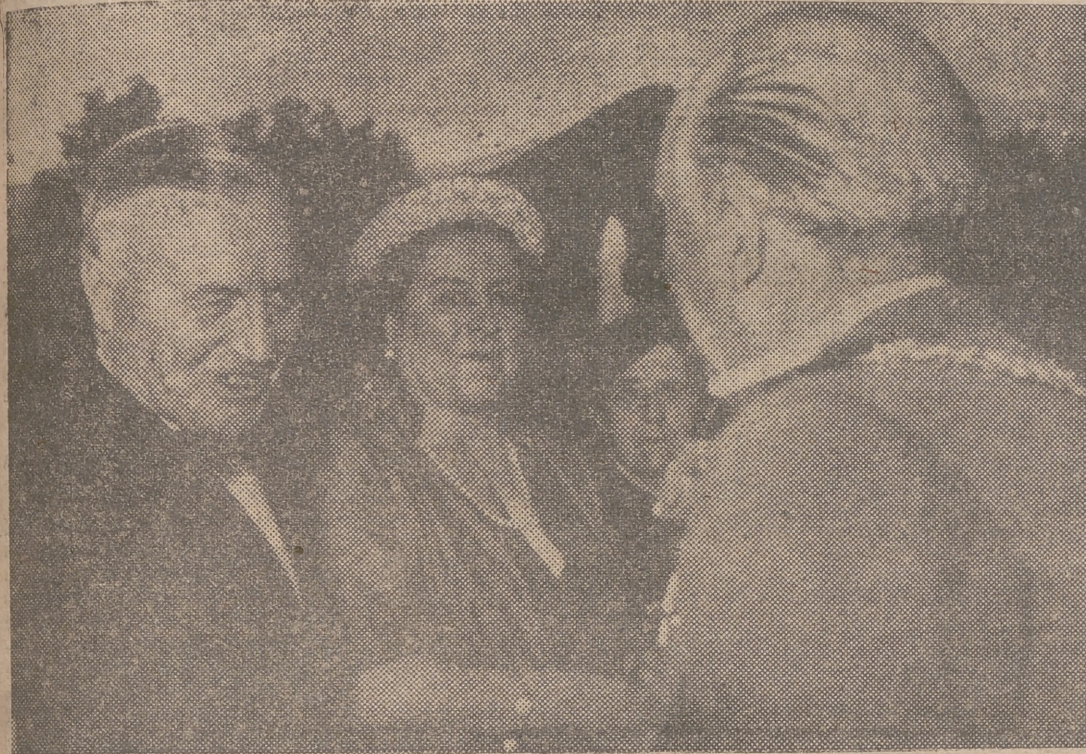
LA GRANJA.—S. E. el Jefe del Estado, Generalísimo Franco, saluda al almirante Sherman, jefe del Alto Estado Mayor de la Armada norteamericana, durante la fiesta celebrada en los jardines de la Granja, con motivo del XV aniversario del Glorioso Alzamiento Nacional