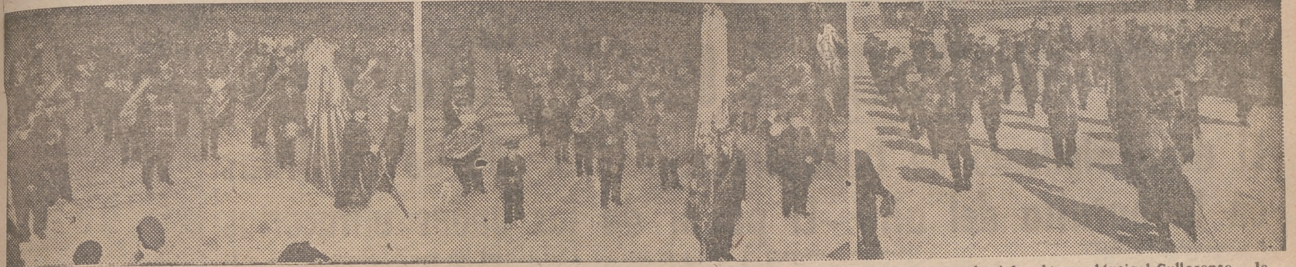
1.—Banda Filarmónica Alcludiana, de Alcludia de Carlet, que ha obtenido el primer premio de la sección especial. 2.—Banda del Ateneo Musical Cullerense, a la que se le ha concedido el máximo galardón de la primera sección. 2.—El primer premio de la segunda sección se lo ha llevado la Banda de la Sociedad Musical "Unión de Pescadores", del Cabañal.