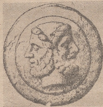
EL DIOS JANO La puerta entreabrirta

La de los occidentales decía así: «1.º Examen de las causas de la presente tensión internacional en Europa, y de los medios de asegurar una mejora real y duradera de las relaciones entre la U. R. S. S., los Estados Unidos, el Reino Unido y Francia, tales como: A) nivel actual de los armamentos en relación con: a) sus efectos