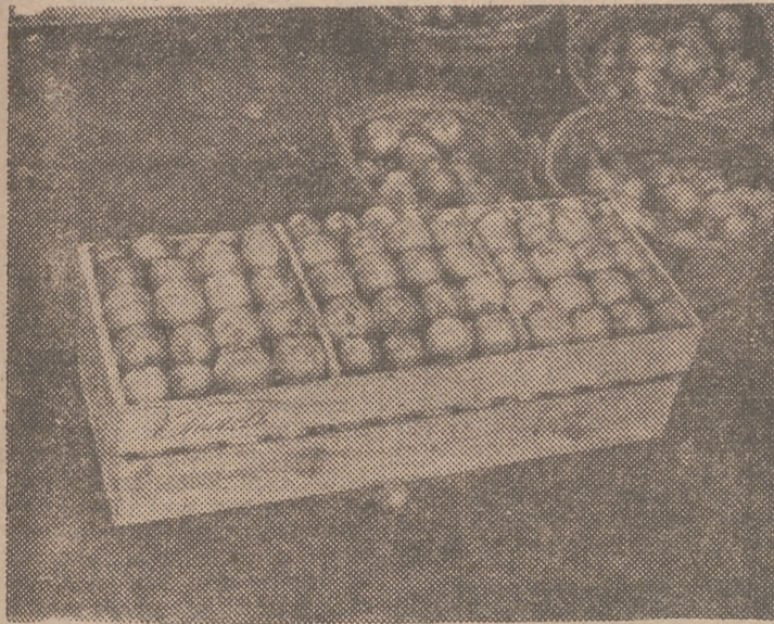
Caja de cebolla, cuyo peso neto es de 58 kilos