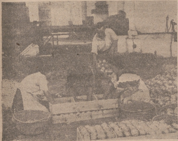
Confección de la cebolla

Dada la importancia de la base, era necesario un terreno de 42 kilómetros cuadrados de superficie, como mínimo. Y ha sido instalada al sur de Burdeos, en las Landas. Después de varias conversaciones, el Gobierno francés cedió a las autoridades norteamericanas, en noviembre de 1950, este terreno con una especie de extraterritorialidad, al mismo tiempo que les concedía toda clase de facilidades para la utilización de los puertos de Burdeos y de La Rochela, que sirven esta región.