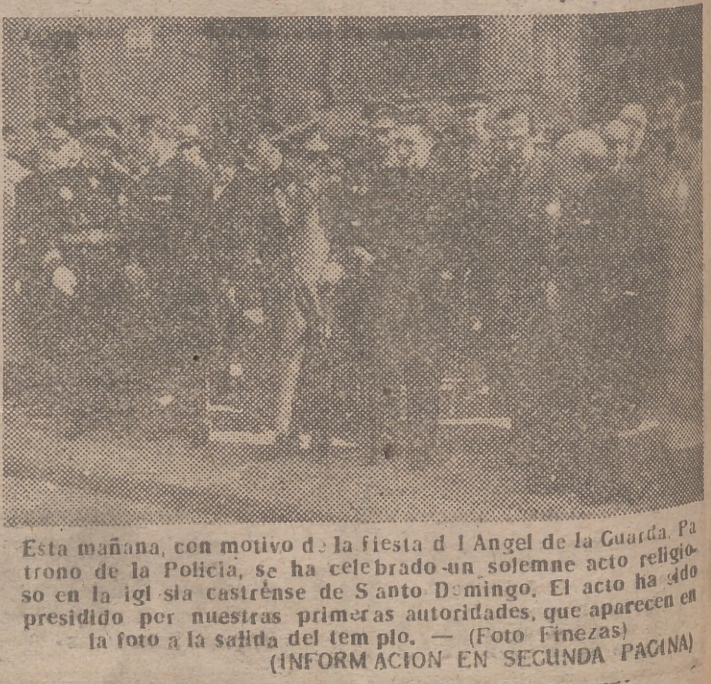
Esta mañana, con motivo de la fiesta de la Guardia de la Policía, se ha celebrado un solemne acto religioso en la iglesia castrense de Santo Domingo. El acto ha sido presidido por nuestras primeras autoridades, que aparecen en la foto a la salida del templo. (INFORMACION EN SEGUNDA PAGINA)