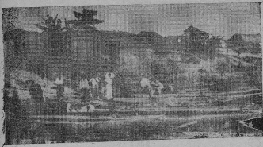
El lago de Tsana, cuya posesión por Italia preocupa a Inglaterra, ya que las aguas del Niño derivan de este lago

este aspecto de la defensa nacional más que en ningún otro, precisa a los elementos directores de la misma, y a los que tan loablemente se prestan a ser sus colaboradores, contar con el apoyo material y moral del resto de los españoles, sin distinción alguna.