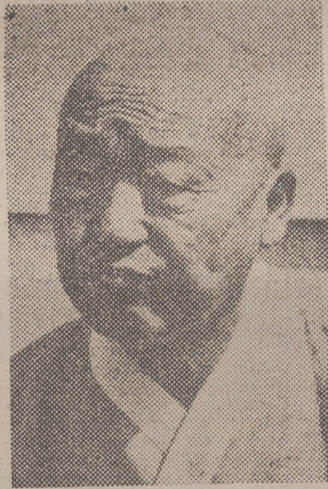
SYNGMAN RHEE Inconcebible

Después viene la cuestión política. Las Naciones Unidas han acordado que la autoridad de Syngman Rhee se limite sólo a Corea del Sur, mientras que la del Norte quedaría bajo una comisión de la O. N. U. Como es lógico, Rhee, protestó de esta decisión, y lo que es más empezó a enclavando que la acción de territorios conquistados, viar gobernadores a los