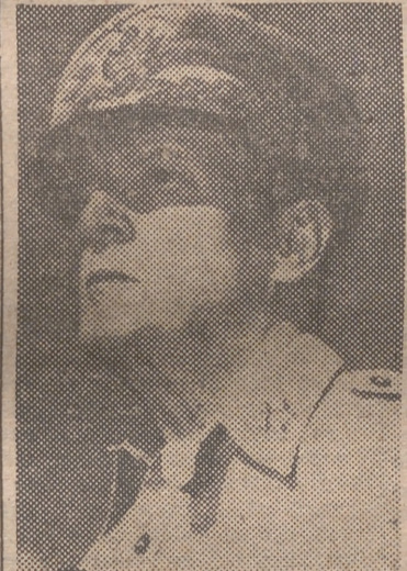
MacArthur dirige personalmente, a bordo de un barco, las operaciones de los aliados

Tokio, 15 (urgente). — El acorazado "Missouri" ha entrado en ac-