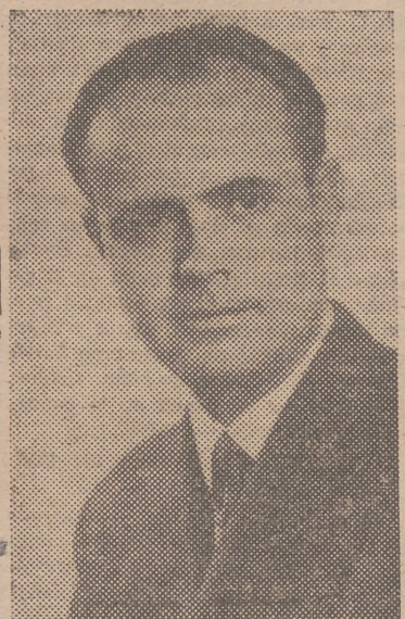
Orquesta de Cámara, de Roma, y de Federico Sopena.